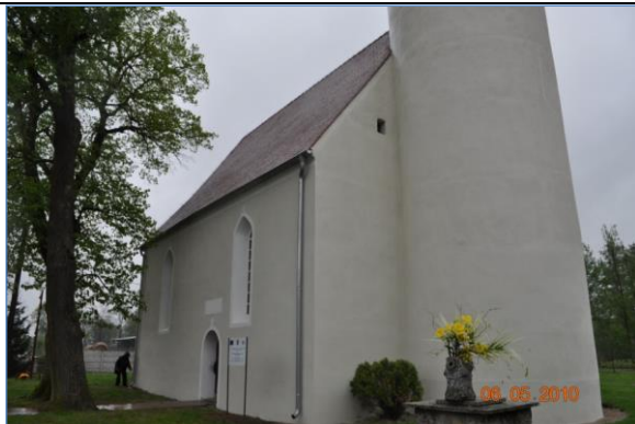
Widok na elewację kościoła od strony północnej