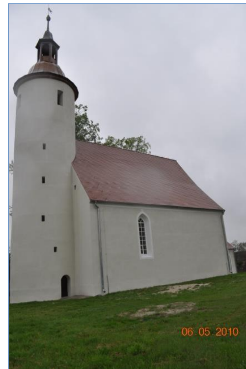
Widok na elewację od strony południowej